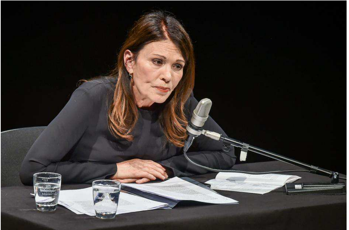
Iris Berben ist Schirmherrin der Stuttgarter Stimmtage.